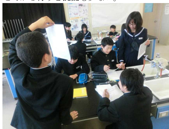
図3 情報交換の場面

※ 各班で班員に番号をつけ、自分の番号の1つ後ろの班に移動して情報交換を行う(1番の生徒は自分の班に残る)。自分の移動先を確認してから行くと混乱も少ない。