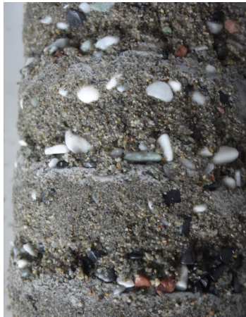
図5 層理を観察する