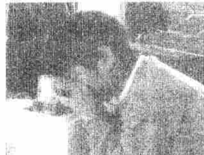
図2 結晶をルーペで見る子供

ったりもう一度付け直したりして、結晶が解けたり、また出来始めたりという現象に興味を持って取り組んでいる様子も見られた。