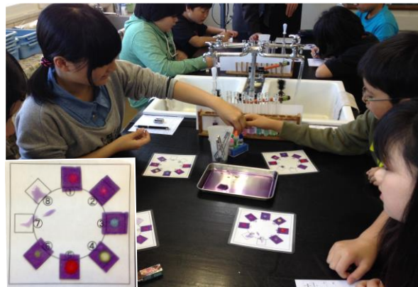
図3 実験Bの様子とその結果

た。道具の操作に慣れていたり、指示薬入りのクッキングペーパーを並べる作業で人数分のピンセットを用意しこと等が、大幅な時間短縮を実現した。ただ、それ以上に、実験Aの結果から各児童により強い興味・関心が芽生えたことも大きく影響していたと考えている。